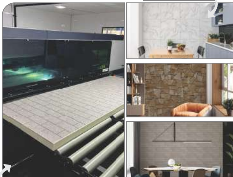
SISTEMA DE IMPRESSÃO DIGITAL